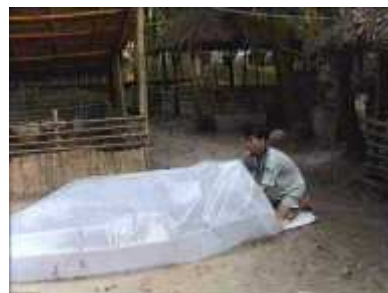
Photo 34. On pompe à nouveau l'air à l'intérieur du tube en plastique