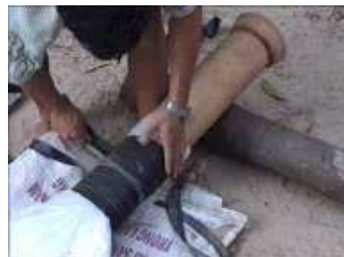
Photo 23. On enroule le caoutchouc autour du plastique pour le fixer au tube