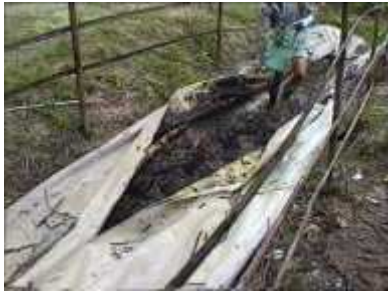
Photo 80. On découpe le plastique pour retirer la matière