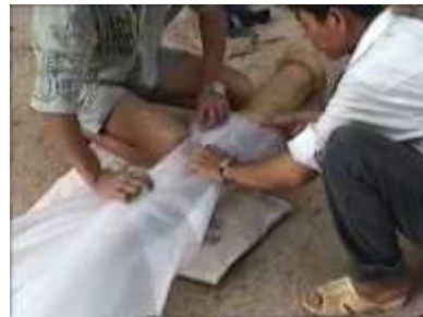
Photo 21. Nous sommes prêt à fixer les éléments ensemble