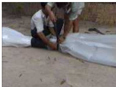
Photo 33. On fixe ce tube de plastique au tube de sortie