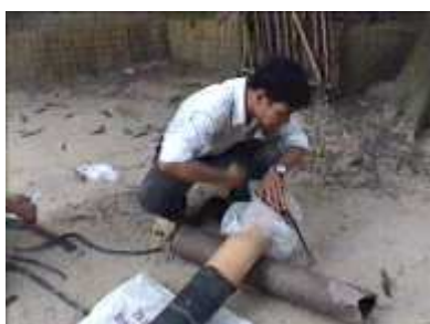
Photo 25. On ferme l'ouverture du tube d'entrée avec un sac plastique

Tout d'abord, on bouche les ouvertures (tube en céramique et point de sortie du gaz) avec un sac plastique et une bande de caoutchouc. Ensuite, il faut remplir le tube plastique d'air avant de le placer dans la tranchée.