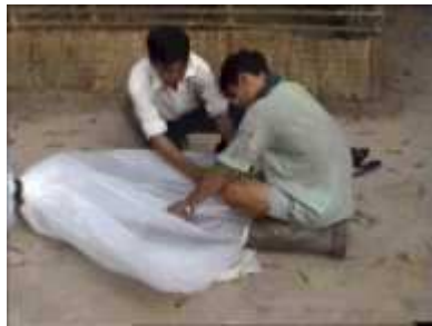
Photo 31. Mise en place du tube de sortie (même procédure que pour le tube d'entrée)

On renferme l'air à l'intérieur du cylindre en plastique. Il ne faut pas oublier de laisser dépasser une longueur de plastique afin d'y insérer le tube de sortie des résidus. On rajoute un élément de plastique d'une longueur de 3 m pour assurer un nouveau remplissage du tube principal.