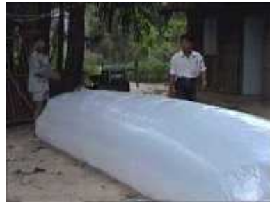
Photo 38. Le digesteur est maintenant rempli d'air