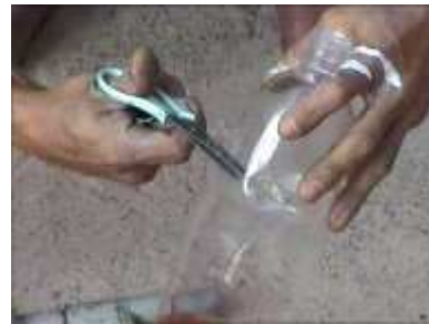
Photo 46. On fait un trou pour ajouter de l'eau