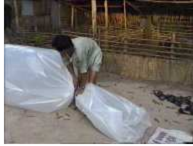
Photo 30. On peut ficeler l'extrémité pour emprisonner l'air tout en laissant de la place pour insérer le tube de sortie

On renferme l'air à l'intérieur du cylindre en plastique. Il ne faut pas oublier de laisser dépasser une longueur de plastique afin d'y insérer le tube de sortie des résidus. On rajoute un élément de plastique d'une longueur de 3 m pour assurer un nouveau remplissage du tube principal.