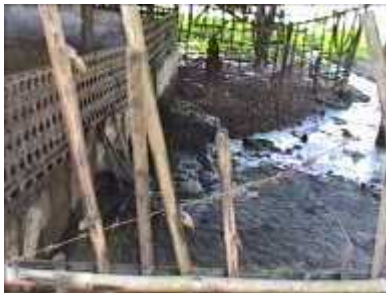
Photo 3. Pollution de l'environnement