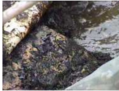
Photo 81. Couche dure de fumier du à l'accumulation de terre et au temps (3 années)