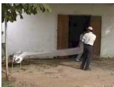
Photo 7. Prélèvement de la bonne longueur de plastique

On déroule la bonne longueur de plastique qui correspondra à la longueur du digesteur. Il est important de prévoir une longueur supplémentaire de 1m de chaque côté pour pouvoir placer les tubes d'entrée et de sortie du digesteur.