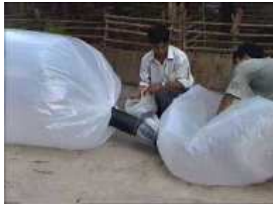
Photo 37. On complète jusqu'à ce que le tube principal soit rempli d'air