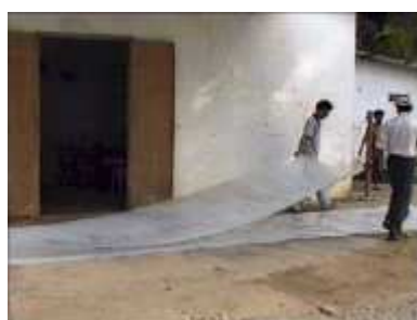
Photo 8. Découpe de la seconde pièce de plastique

Deux longueurs de plastique sont nécessaires car elles seront placées l'une dans l'autre pour assurer une meilleure résistance de la paroi du digesteur.