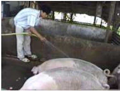
Photo 1. Nettoyage d'une porcherie

Les images suivantes illustrent la pollution de l'environnement par les déjections animales dans une exploitation :