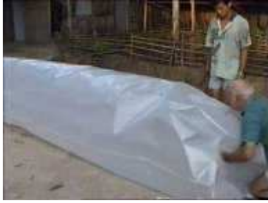
Photo 29. Le digesteur est rempli d'air