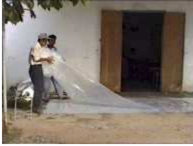
Photo 9. On met en boule une des deux pièces de plastique afin de la mettre à l'intérieur de l'autre