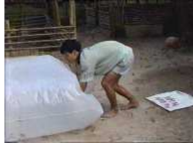
Photo 36. On force l'air à passer du tube de 3m de long au tube principal