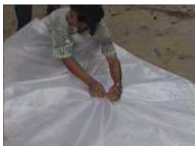
Photo 14. Maintenir le plastique