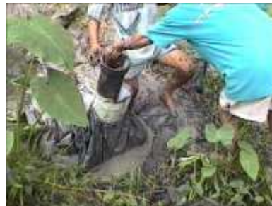
Photo 85. Récupérer les bandes de caoutchouc et les tubes d'entrée et de sortie du fumier