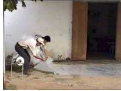
Photo 10. Début de la phase d'enfilement des deux pièces de plastique qui augmentera la résistance du digesteur