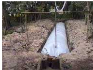
Photo 67. L'installation est terminée