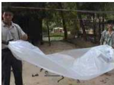
Photo 56. On assure une bonne connexion entre les deux éléments