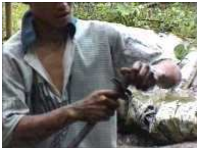
Photo 84. Récupérer le système de captage du gaz