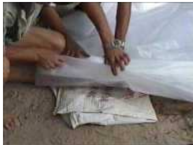
Photo 20. On recouvre de chaque côté