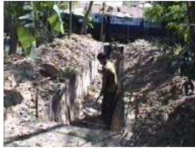
Photo 5. Réalisation d'une tranchée dans le sol

Afin de faciliter l'écoulement du lisier, il est préférable que celui-ci coule par gravité directement de la source vers l'entrée du digesteur.