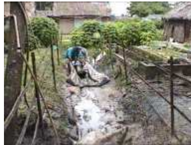
Photo 83. Tirer le plastique hors de la tranchée