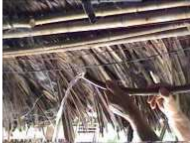
Photo 76. Accumulation d'eau (pb 6-1) : ouvrir le joint pour évacuer l'eau