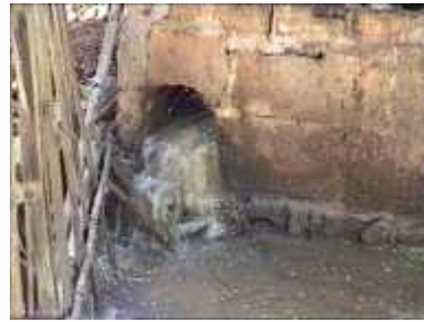
Photo 2. Les déchets liquides s'écoulent à l'extérieur de l'enclos