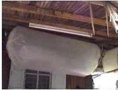
Photo 62. Une corde autour du réservoir est utilisée pour augmenter la pression