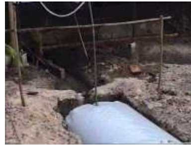
Photo 65. Le conduit est relié au digesteur