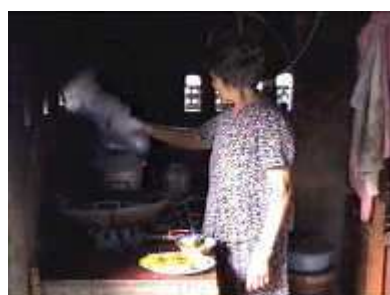
Photo 60. Il faut connecté le réservoir de gaz à l'entrée de gaz du poêle