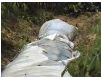
Photo 79. La couche supérieure de plastique est déchirée (au bout de 3 ans)