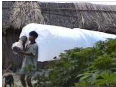
Photo 39. Transport du digesteur

Ensuite, il est nécessaire de remplir d'eau le digesteur jusqu'à ce que les tubes d'entrée et de sortie soient parfaitement recouverts d'eau (à l'intérieur du digesteur). L'air est maintenant piégé à l'intérieur du digesteur et l'on peut retirer les films de plastique à l'entrée et à la sortie du digesteur.