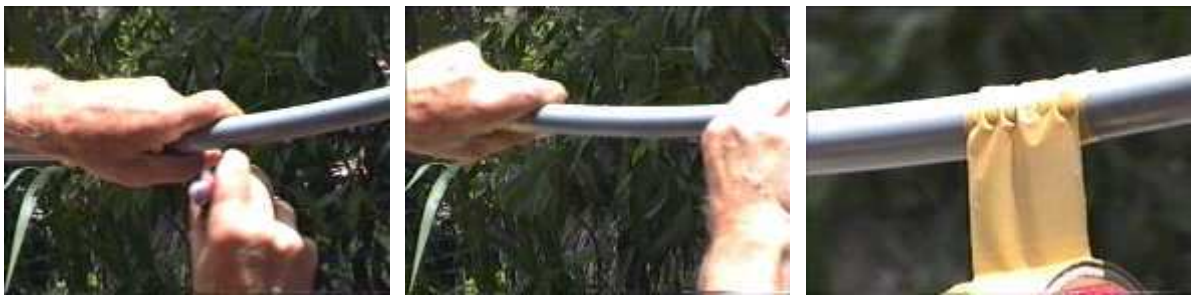
Photo 77. Faire un trou dans le conduit en PVC, laisser couler l'eau, reboucher avec une bande de scotch (pb 6-2)