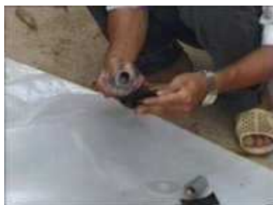
Photo 16. Mise en place des éléments nécessaires à la réalisation du tuyau de sortie du gaz