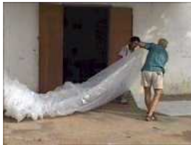
Photo 11. On place les deux pièces de plastique l'une dans l'autre