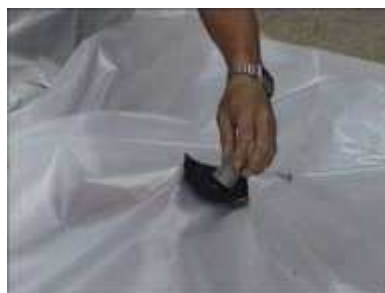
Photo 17. Il reste à visser les deux adaptateurs entre eux