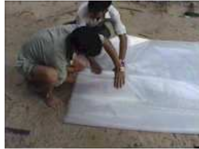
Photo 19. On commence à recouvrir le tube à l'aide du plastique