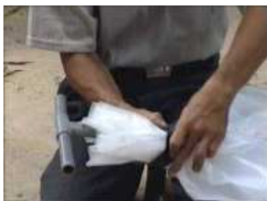
Photo 54. On place un nouveau tube en forme de « T » à l'autre ouverture du futur réservoir : un bout sera connecté au digesteur, l'autre à l'appareil alimenté en biogaz