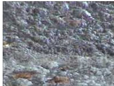
Photo 4. Production de méthane et pollution de l'air

La mise en place d'un digesteur va permettre d'utiliser le lisier afin de produire du biogaz utile mais aussi de diminuer la charge polluante de cette biomasse.