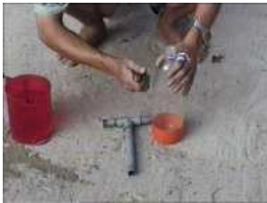
Photo 45. Eléments nécessaires à l'élaboration du piège à eau (PVC en forme de « T », bouteille plastique, couteau et eau)

Il ne reste plus qu'à suspendre le piège à eau de façon à pouvoir le remplir facilement et à le connecter aux tubes d'arrivée et de sortie du biogaz.