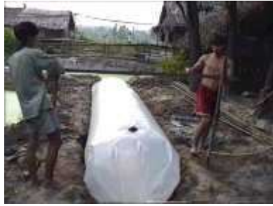
Photo 41. Un support est mis en place pour soutenir le tuyau de distribution du gaz