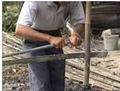
Photo 43. Connexion du tuyau de distribution du gaz au support