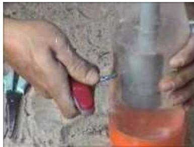
Photo 47. On insère le tube en PVC dans la bouteille, on remplit d'eau et on fait un petit trou pour fixer le niveau d'eau