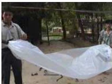
Photo 58. On suspend le réservoir en dessous du toit