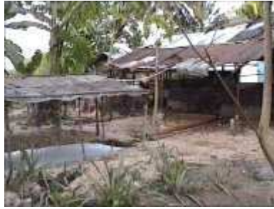
Photo 74. Le système complet : un toit peut protéger le biodigester des rayons UV.