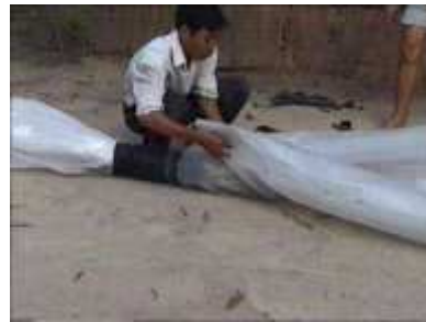
Photo 32. On place un tube de plastique supplémentaire d'une longueur de 3m