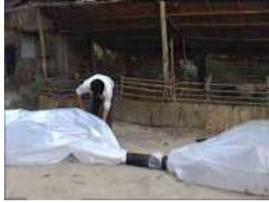
Photo 35. On libère le premier tube en plastique de la ficelle qui l'entoure