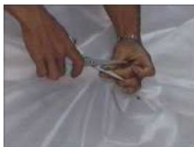
Photo 15. Découper le plastique