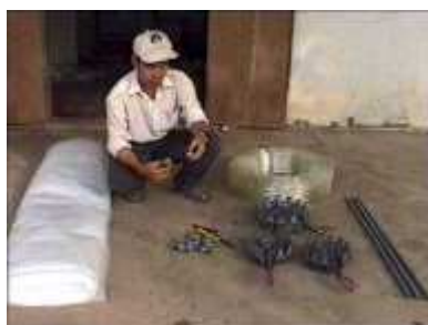
Photo 6. Matériaux nécessaires à la mise en place d'un digesteur en plastique