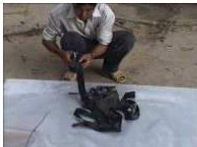
Photo 22. On découpe une bande de caoutchouc