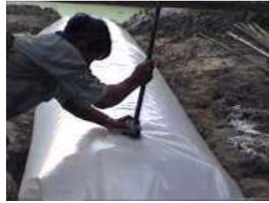
Photo 42. Connexion du tuyau de distribution au tube de sortie du gaz