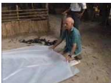
Photo 27. Tenir le plastique