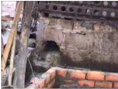
Photo 64. Un conduit est réalisé à l'aide de briques pour diriger les déchets liquides vers l'entrée du digesteur

On peut réaliser un conduit à l'aide de briques et de ciment pour relier l'évacuation des déchets et le tube d'entrée du digesteur.