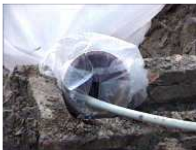
Photo 44. On peut brancher un tuyau d'arrivée d'eau si une pompe est disponible