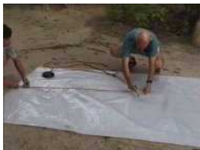
Photo 12. On mesure la bonne distance

La taille du trou dépend du diamètre extérieur de l'adaptateur mâle en PVC.