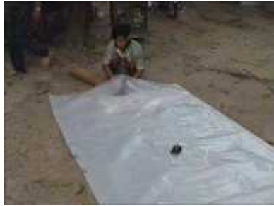
Photo 18. Mise en place du tube à l'entrée

On insère le tube en céramique jusqu'à moitié de sa longueur dans la pièce de plastique. Le joint entre les deux éléments est assuré par une bande de caoutchouc que l'on enroule tout autour.