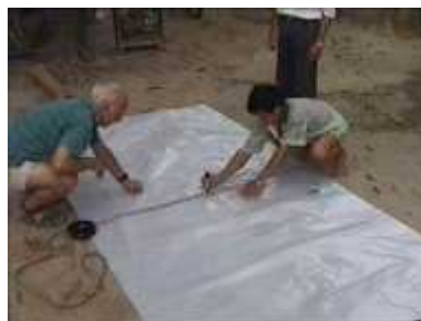
Photo 13. On fait une marque pour découper le plastique