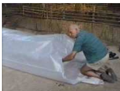
Photo 28. On pompe l'air pour remplir le digesteur