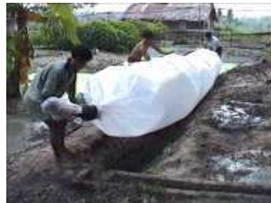
Photo 40. On place le digesteur dans la tranchée