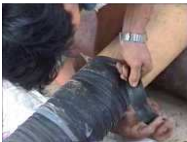
Photo 24. On complète pour assurer une bonne fixation